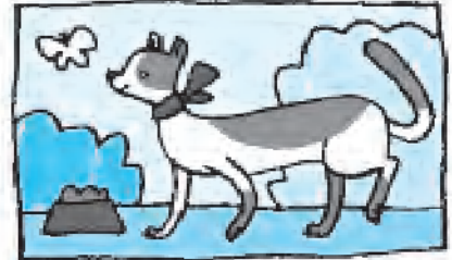
Il gatto è un animale.

1 Nelle seguenti frasi, sottolinea in blu l'azione, in rosso il modo di essere, in verde lo stato.