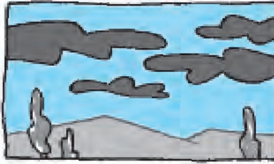
Il cielo è nuvoloso.