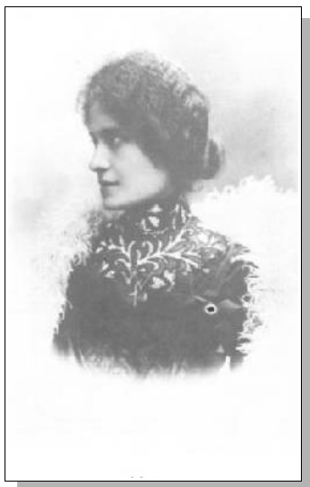
Ada Negri Lodi 1870 – Milano 1945

La poetessa ci comunica la bellezza di una nevicata e lo stupore che si prova davanti ad un paesaggio ammantato di neve.