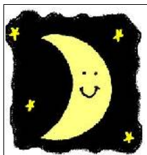
Il freddo della notte