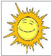
Il caldo del giorno

Quali sono le cause della trasformazione delle montagne?