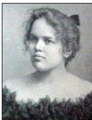
Adelaide Crapsey, creator of the American cinquain.

Adelaide Crapsey fu una poetessa americana (New York, 1878 - 1914)