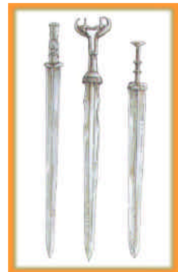
SPADE DI FERRO

Gli aratri rinforzati con il vomere di ferro riuscivano a spaccare anche i terreni più duri. Le armi di ferro poi, in battaglia, erano assai più efficaci di quelle di bronzo. Il ferro cambiò la storia della Cina e le garantì progressi tecnici impensabili.